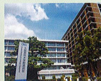
●大阪医科大学附属医院