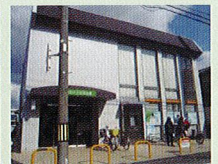
●北おおさか信用金庫十三高槻店