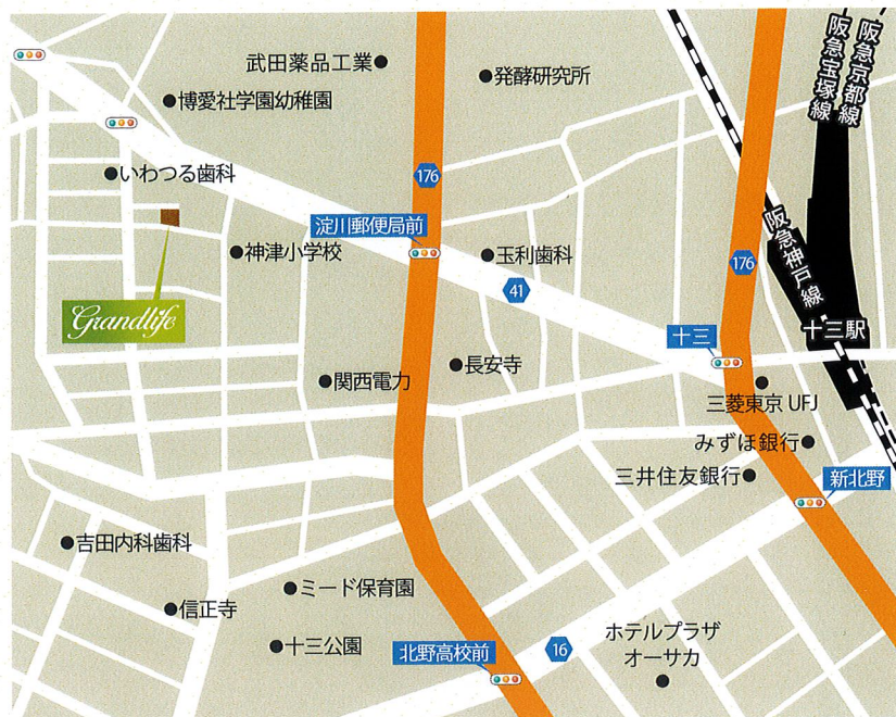
阪急電鉄「十三」駅より徒歩8分