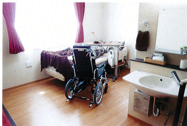
【居室】 ※画像はイメージです。 エアコン、トイレ、洗面化粧台、クローゼット全室完備。

安心のバリアフリー設計で、 充実したセカンドライフをお過ごしいただけます。 居室は完全個室。13.7㎡～13.8㎡の広さのお 部屋は、ご自分のお好きなようにインテリアを レイアウトしていただけます。 コミュニティホールでは、ご自由にくつろいでい ただいたり、入居者様と交流を図ったり、憩いの ひとときをお過ごしいただけます。