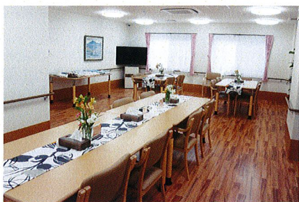
【コミュニティホール】