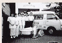
1986年当時、まごころ一号車 (訪問入浴車) 前での写真