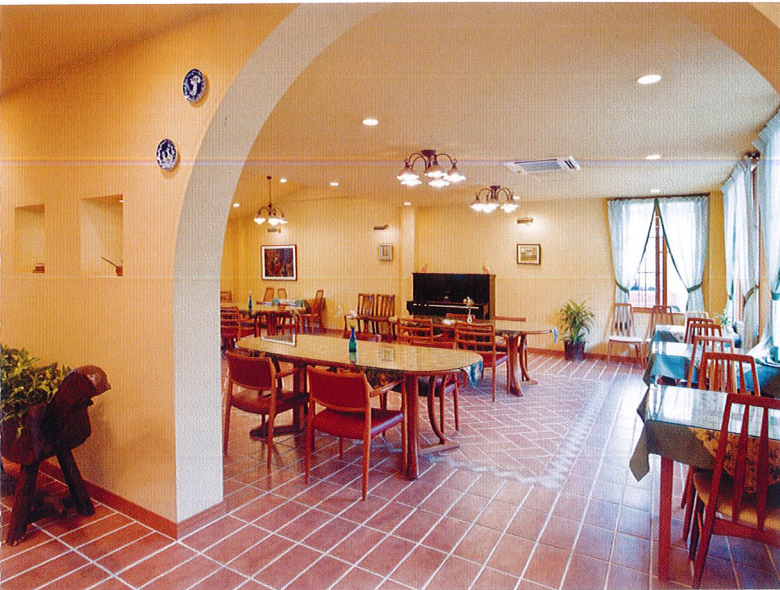
ダイニング アーチ状の壁など豊かな空間の表情で、開放感と明るさに個性を演出したダイニング。お食事の時間に趣を添えます。