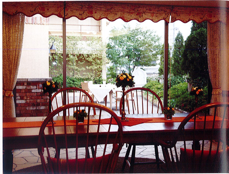
ロビー・テラス 自由にお使いいただける憩いのスペース。テラスではBBQパーティーを行うことも。