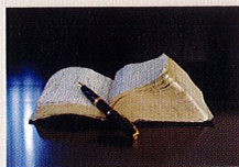
新約聖書 マタイの福音書22章39 「あなたの隣人をあなた自身のように愛せよ」