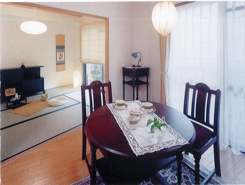
居室 和室も備えた居室。お風呂やキッチンもついており、ご夫婦でもご入居いただけます。