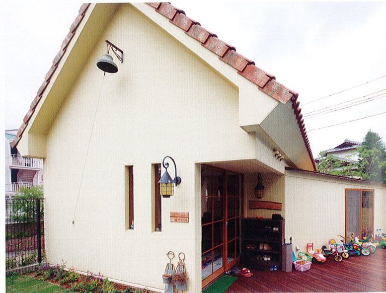
のぼらみんなの子育てひろば 風のガーデン内にある地域のお子さまが集う子育てひろば。可愛らしくにぎやかな声が響いています。