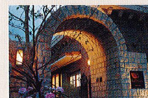
ロングライフ成城