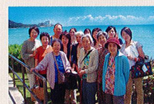
2005年、初めての海外旅行 ハワイにて