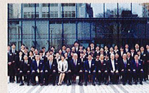
2014年度新入社員入社研修