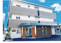
ハートランド 東大阪