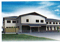
ハートランド 岩倉