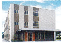
ハートランド 倉敷