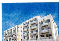
ハートランド 枚方