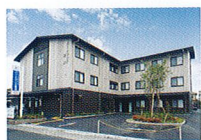
ハートランド 奈良