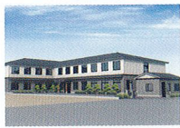
ハートランド 湖西