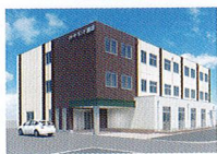
ハートランド 瀬田