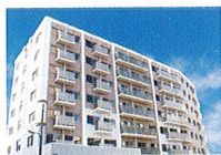
ハートランド 西淀川