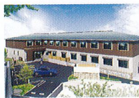
ハートランド 生駒