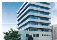
ハートランド 淀川