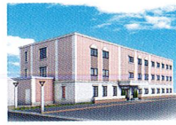
ハートランド 高槻