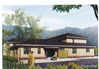
ハートランド 洛北