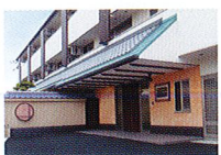
ハートランド 羽曳野