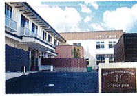
ハートランド 富田林