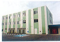
ハートランド 和歌山