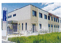
ハートランド 南志賀