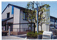
ハートランド 北花田