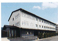
ハートランド 山科