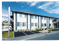
ハートランド 守口